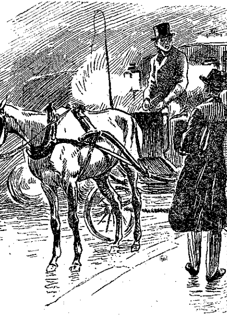
«Ἀμαξῶ, στὸ σταθμὸ τοῦ Ἀγίου Λαζάρου!» (Σελ., 178 στ. β')

Νέα ζωὴ ἄρχισε γιὰ τὸν τρομερὸ κακοῦργο.