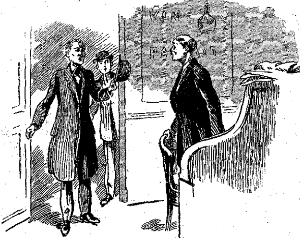
«Είς τί χρεωστώ τήν τιμή της επισκέψεώς σας;...» (Σελ. 166, στ. β')

Ο κακούργος έννόησε τότε ότι ήταν χαμένος. 'Εσφίξε τούς γρόθους μ' ένα σπασμό στο πρόσωπο, έτοιμος να συν-